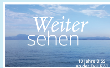
Postkartenreihe zum 10. BISS Geburtstag